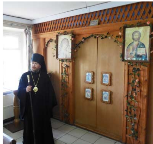
Пресс-служба Яранской Епархии.